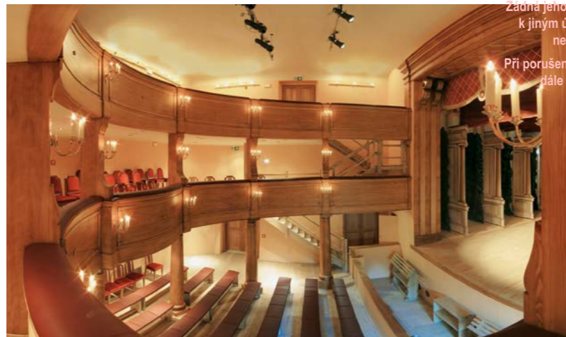
Valtice, zámecké divadlo, stav po rekonstrukci