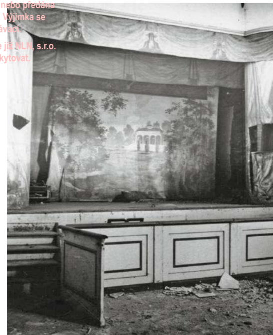
Hrádek u Nechanic, zámecké divadlo, zničené v roce 1994

FOTO © MATEJ BOHÁČ (HULEC A ŠPIČKA - ARCHITEKTI)