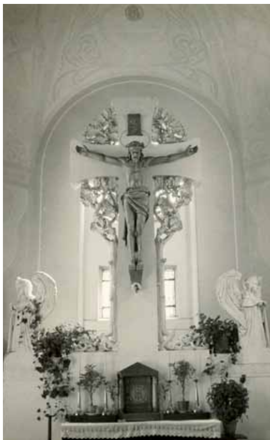
Pohled na hlavní oltář s částí maleb na klenbě. Autor neznámý, zřejmě po 1935 (kopie v archivu farnosti)

V literatuře se objevuje zmínka o tom, že o stavbu starokatolického kostela projevil zájem hned pět architektů nebo stavitelů 15 a kromě Zascheho se také spekulovalo o jiných možných autorech realizované stavby. 16