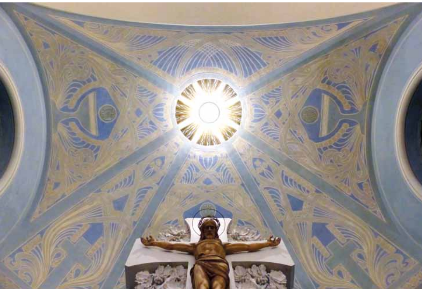
Celkový pohled na klenbu po restaurování.