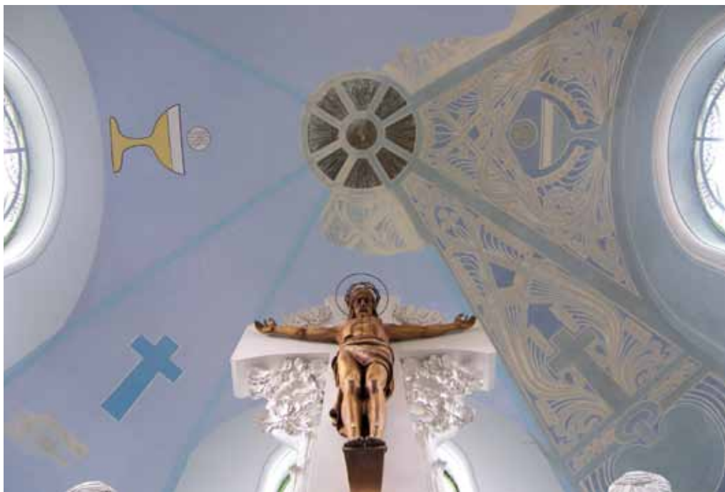
Pohled do presbytáře po dokončení první etapy restaurování. Vlevo novodobá vrstva z roku 1982 s motivy převzatými z původní malby Foto Jiří Bláha, 2013