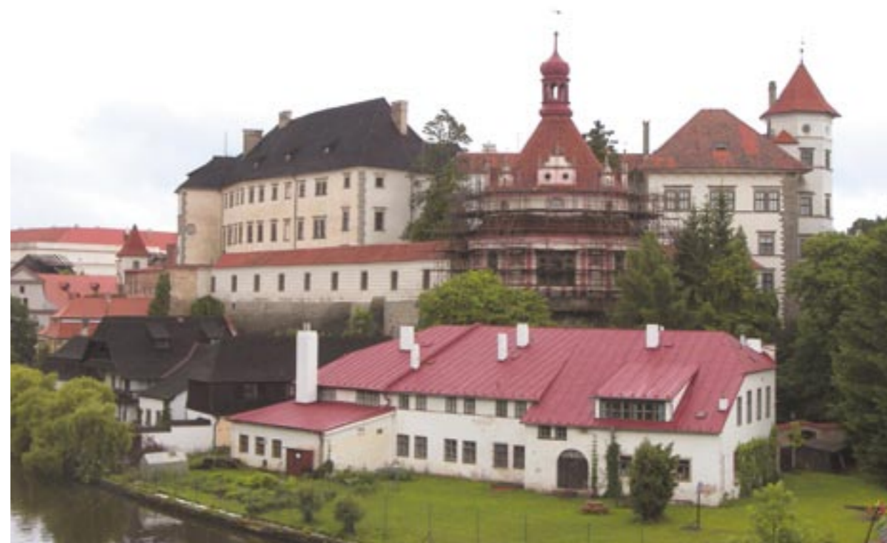
Obr. 2: Pohled na zámek s Rondelem přes řeku Nežárku v průběhu rekonstrukce, jaro 2012

Další oprava, projektovaná v rámci generální rekonstrukce zámku v 80. letech, byla dokončena až v roce 1994, kdy Rondel získal růžovo-bílou barevnost, ze které nelogicky – ale v souladu s dobou a částečně i dnešní praxí – vystupovaly šedé kamen-