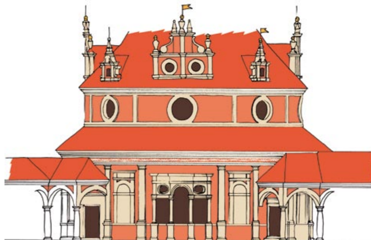
Obr. 8: První návrh barevného řešení Rondelu bez detailního řešení římsy a kanelury na pilastru v přízemí, s později změněnou podobou soklové části

Na základě těchto zjištění vznikl v průběhu prací návrh nové barevnosti Rondelu (obr. 8). Detaily návrhu se měnily až v průběhu prací a zkoušek přímo na fasádách (sokl). Na základě nálezů jsme navrhli červené (terakotové) základní plochy, světlou (režnou) barvu tektonických článků (která korespondovala s původně světlejší barvou nenatíraného kamene) a lomenou bílou barvu obou hlavních říms. Výsledkem není návrat k historickému stavu, jehož důležitou část neznáme (dekor a obrazy v základních plochách), ale současná interpretace nálezů s využitím základního barevného schématu původní podoby (základní červená barva v plochách omítek, ze kterých vystupují světlejší tektonické články) a jejich doložených výzdobných prvků (římsy, vlysy, pilastry).