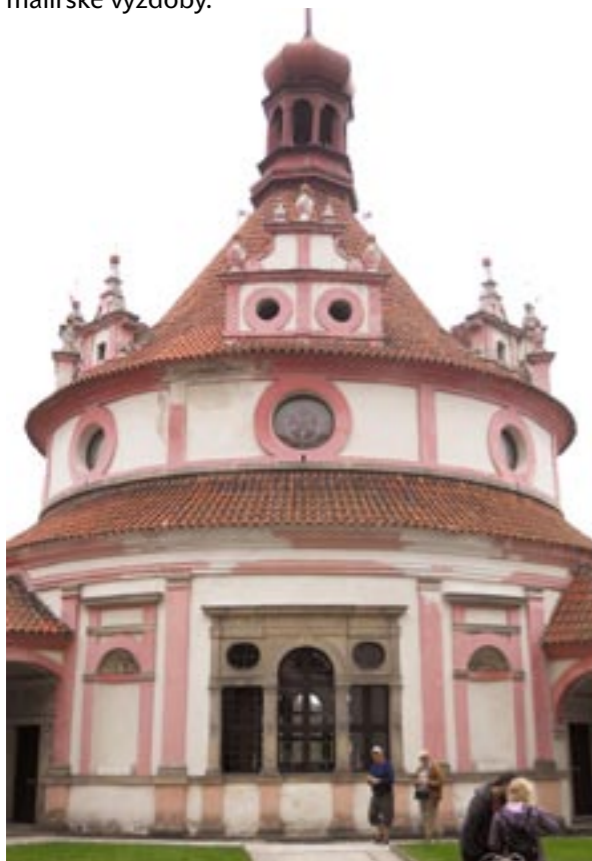
Obr. 1: Státní hrad a zámek Jindřichův Hradec, hudební pavilon Rondel. Pohled na Rondel ze zámecké zahrady před rekonstrukcí (2010). V ahistorickém barevném řešení z opravy v r. 1994 se nelogicky uplatňují kamenné prvky

Hudební pavilon Rondel v zahradě jindřichohradeckého zámku je jednou z nejhodnotnějších staveb pozdní renesance u nás. Poslední velká oprava na přelomu 80. a 90. let 20. století se soustředila především na opravu bohaté štukové výzdoby interiéru, exteriéru vtiskla technicky i esteticky nepříliš zdařilou podobu. Během obnovy pláště Rondelu v roce 2012 se podařilo získat informace o dosud téměř neznámé nejstarší podobě fasád pavilonu a rekonstruovat alespoň část jejich původní bohaté malířské výzdoby. 1